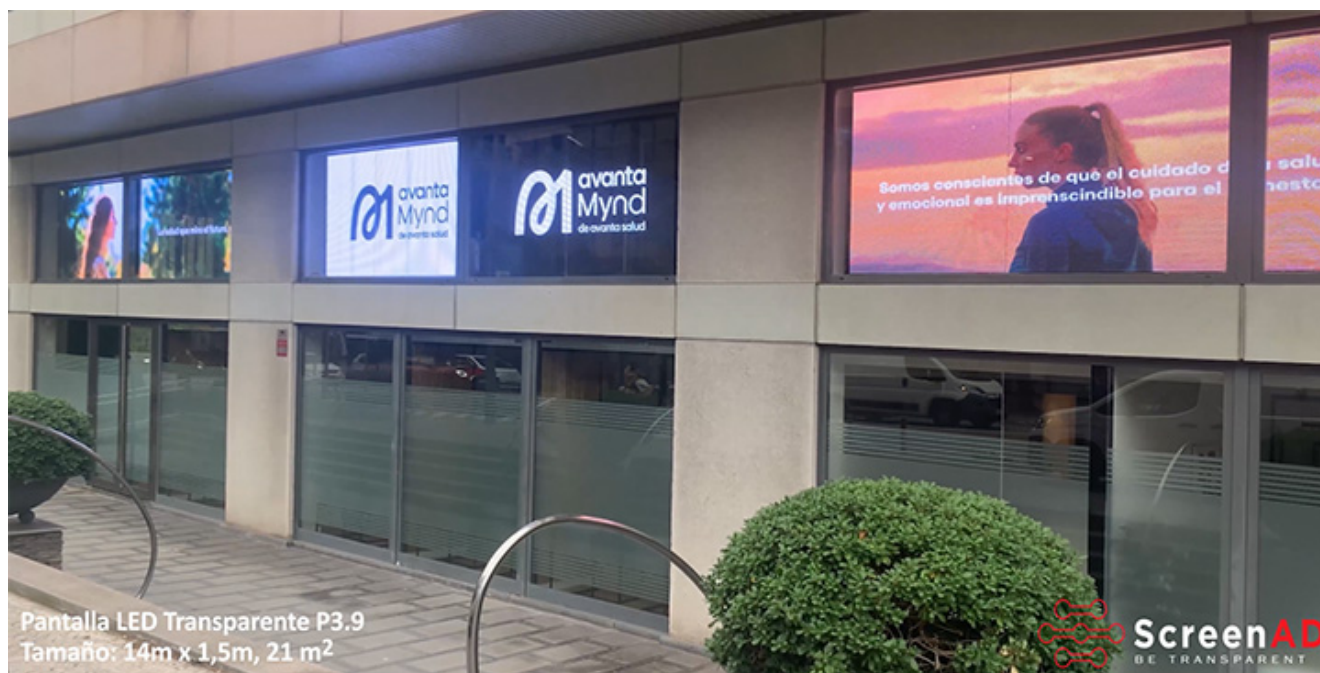
Pantalla LED Transparente P3.9 Tamaño: 14m x 1,5m, 21 m 2